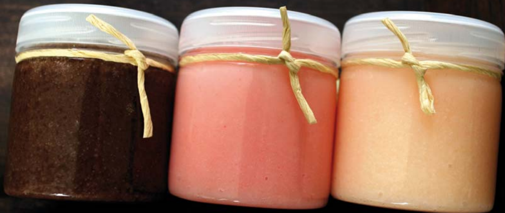
Vartalonkuorintavoitteet Suklaa, Mansikkakerma ja Greippi.